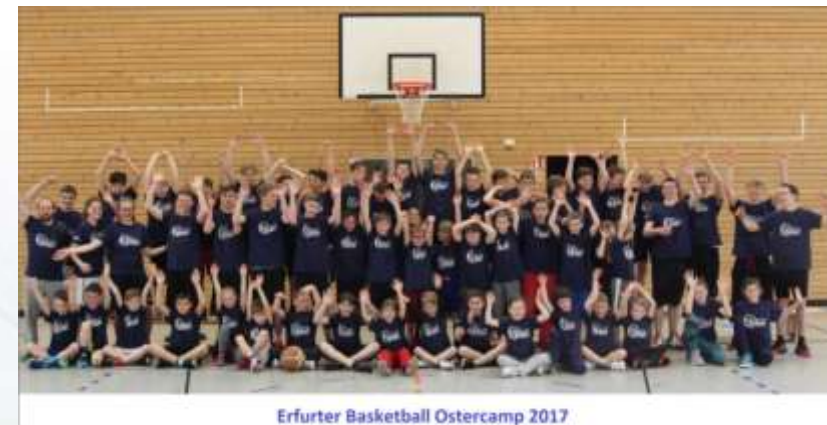
Erfurter Basketball Ostercamp 2017